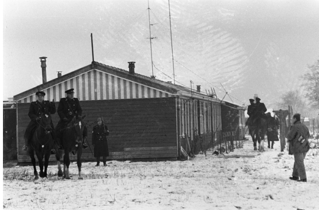
Ontruiming van de laatste bewoners in het kamp Schattenberg in 1966.

te worden dat het veelal ook ging om persoonlijk leiderschap en persoonlijke tegenstellingen. Het verscherpen van tegenstellingen van welke aard dan ook heeft in de afgelopen jaren geleid tot 'politieke verdeeldheid' binnen de Molukse geleerden en het bestaan van vele kleine, bijna sectarische, belangengroeperingen (bv. de groep Leasa). (Rinsampessy 1975, 15)