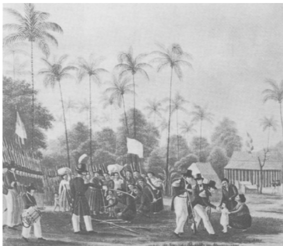
Het wedervinden van het enig kind vinden vermoorden Resident Van den Berg. Aquarel door Q.M.R. Ver Huell (fragment)

Na de verovering van fort Duurstede op het eiland Saparua op 14 mei 1817 volgde, in fases, een bloedige strijd, waarbij aan beide kanten vele slachtoffers vielen.