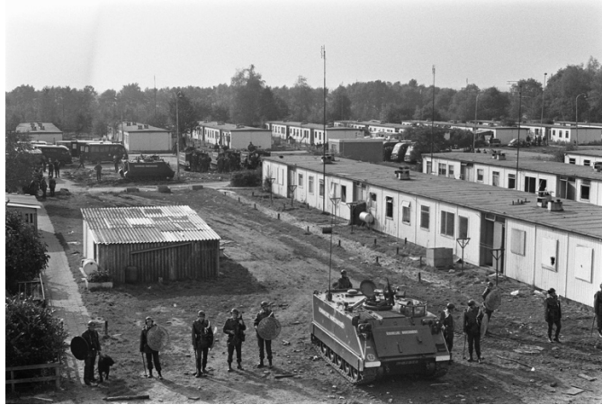
De ontruiming van het Molukse kamp Vaassen