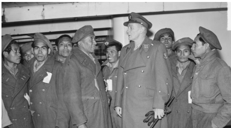
'Ambonese' Molukse KNIL-militairen