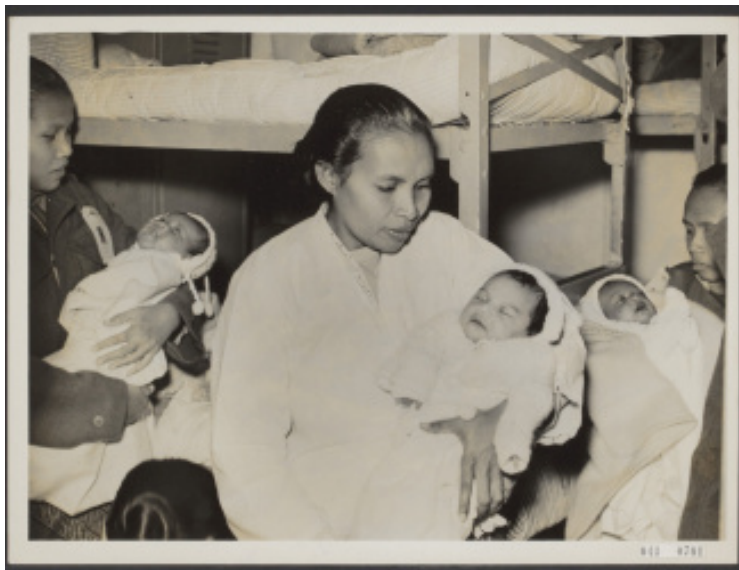
Molukse baby's onderweg naar Nederland geboren in 1951

Het besluit om de Molukse 'Ambonese' militairen te ontslaan werd pas bekend gemaakt nadat op 21 maart 1951 de Kota Inten als eerste schip met Molukkers in de Rotterdamse haven was gearriveerd. Daar kregen de militairen te horen dat zij waren 'gedemilitariseerd', ontslagen.