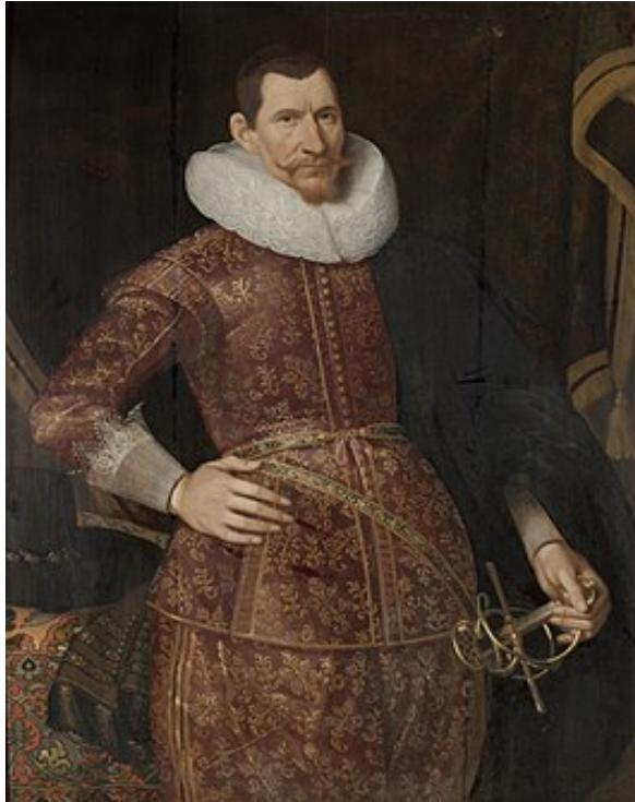
Jan Pieterszoon Coen

bevolking, die zich verborgen hield in de heuvels, en vluchtroutes via zee werden afgesneden, stierven duizende mensen van kou, honger, ziekten. Nog meer mensen pleegden zelfmoord door van de rotsen hun dood tegemoet te springen. Van de geschatte 15.000 mensen van de bevolking van Banda, schijnt niet meer dan een duizendtal het er op de eilanden levend te hebben afgebracht. Een paar slaagden erin de blokkades te ontwijken en vonden een toevluchtsoord op Seram, Aru en Kei.