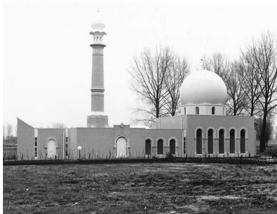
Moskee An-Nur Waalwijk

Molukse Moskee An-Nur (Het Licht). Architect Latief Perotti.