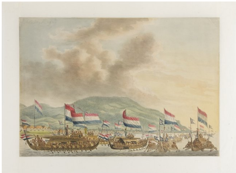
Hongivloot van Ternate op weg naar Ambon in 18

Een strijdmacht bestaande uit beroepssoldaten en inheemse troepen uit Ambon-Lease, waarvoor elk dorp, naar gelang de grootte, een vastgesteld aantal mannen en oorlogspauwen moest leveren. Voor het onderhoud ervan waren de dorpen zelf verantwoordelijk. Naast deze militaire expedities waren er strafexpedities en regelmatige inspectiereizen, die alle tezamen hongi-tochten genoemd werden.