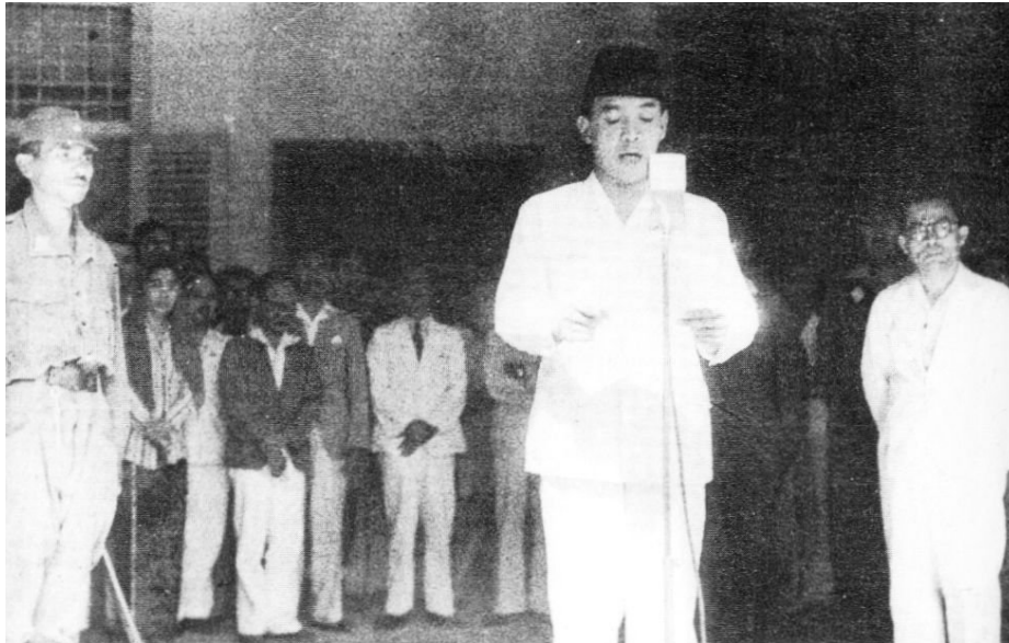
Soekarno roept op 17 augustus 1945 de onafhankelijke staat Indonesië uit. Aan zijn linkerkant staat Mohammed Hatta.

een eenheidsstaat. De Nederlanders gesteund door de Ambonezen, bepleitten een deelstatenconstructie, waarin elke deelstaat een grote mate van autonomie zou behouden.