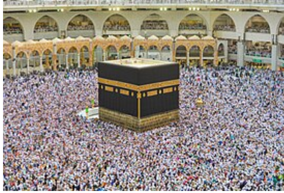
The Kaaba at Masjid al-Haram in Mekka, Saudi Arabia,