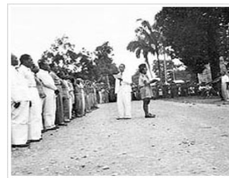
Proclamatie van de RMS.