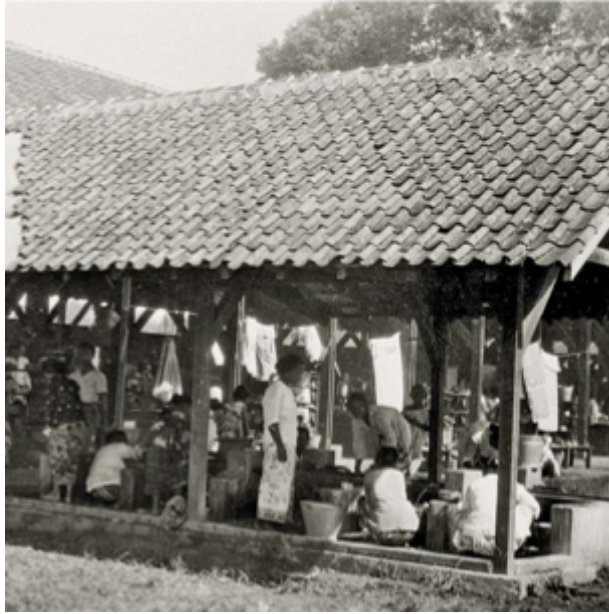
Tangsi's : De vrouwenloods van het Eerste Bataljon Infanterie te Magelang,

'appartement' had een muurkastje en schapje. Dit was de leef- en woonsituatie van veel 'Ambonese' KNIL-militairen en hun gezinnen. Er was nauwelijks privacy. De chambrees waren aan de bovenkant open, alle nachtelijke geluiden waren in de hele loods te horen. Het huilen van baby's, het geklaag van zieke kinderen, ruzies tussen echtelieden, dat alles maakte dat er van nachtrust niet veel terecht kwam.