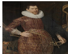
Jan Pietersz Coen