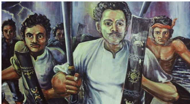
Thomas Matulesy of Pattimura 1783-1817