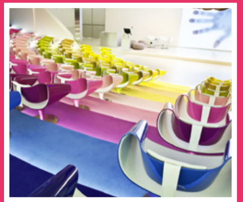
1 Media Plaza