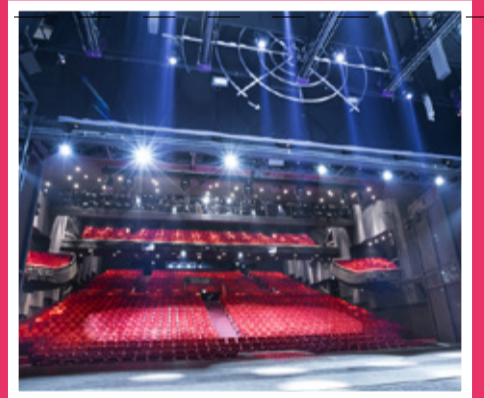
8 Beatrix Theater